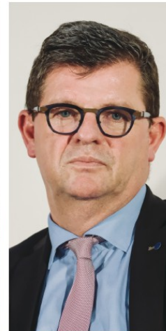
Bart Tommelein steunt de beslissing.